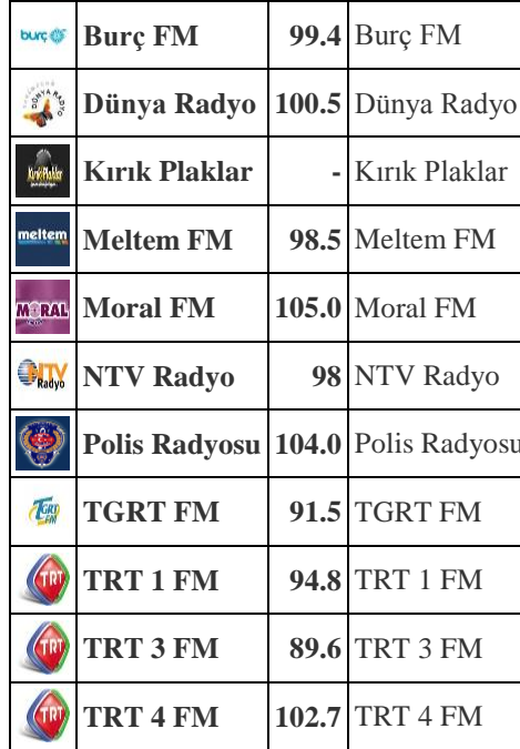
Tablo 3: Elazığ'da yayın yapan ulusal radyolar

Ulusal yayın yapan ve Elazığ'dan dinlenen radyoların adları ve frekansları aşağıda Tablo 3'de verilmiştir (Radyobul.net, 2014)