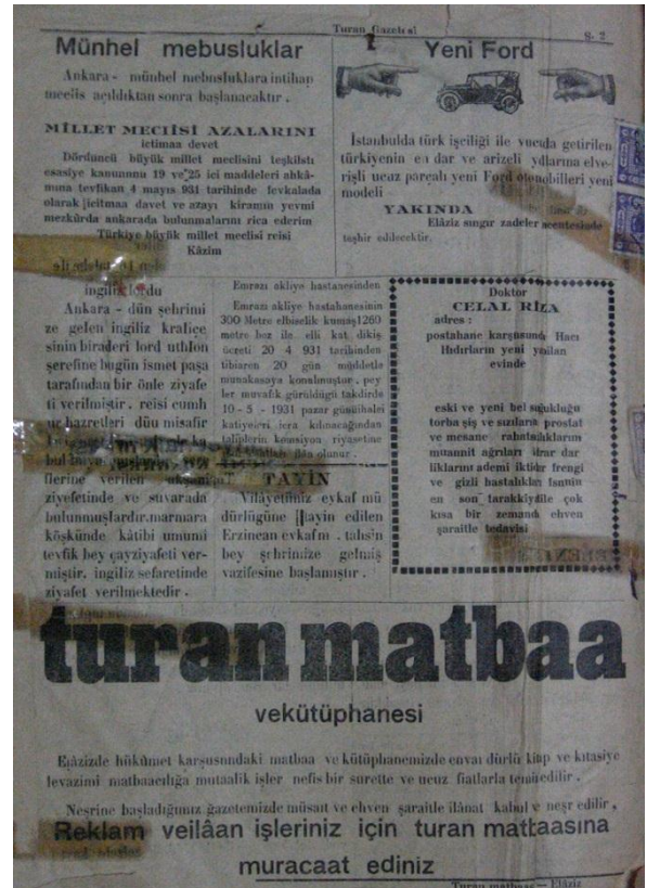
Resim 1. 1 Mayıs 1931 tarihli Turan Gazetesi