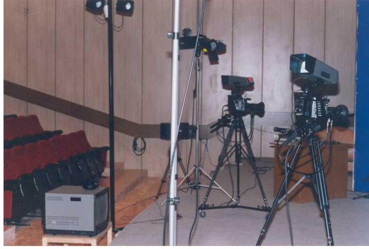
Resim 2: YÖK/Dünya Bankası II. Endüstriyel Eğitim Projesinden Gelen Yarı Profesyonel Kameralar

Üçüncü kaynak Fırat Üniversitesi Teknik Eğitim Fakültesi Döner Sermaye İşletmesi idi. Müdürlüğü tarafından yürütülen bu işletmede YÖK, MEB, DİE, DPT vb. kamu kurum ve kuruluşları ile özel sektöre verdiğimiz hizmetlerden elde ettiğimiz gelirlerin önemli bir bölümünü Fırat Televizyonuna alet ve cihazlar almak için harcıyorduk.