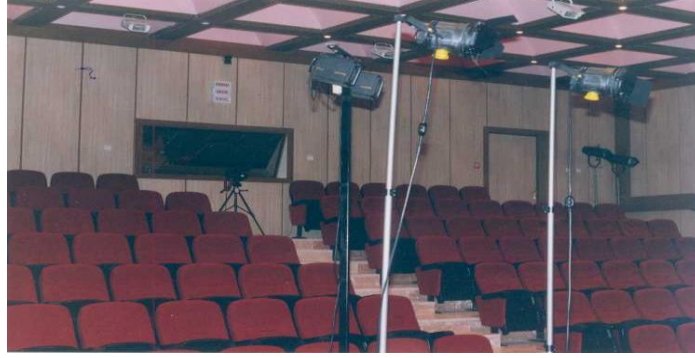
Resim 1: FIRAT TV’nin Stüdyosundan Bir Görünüm

Başlangıçta küçük bir odadan ve çatı üzerine kurulan vericiden yapılan yayın için bilahare Teknik Eğitim Fakültesi Elektronik ve Bilgisayar Eğitimi Bölümü içinde yer alan laboratuvarları kullanmaya başlamıştık. Bu arada modern 120 koltuk kapasiteli bir stüdyo inşaatı da devam ediyordu. TRT’den uzmanlar getirterek, önceleri konferans salonu olarak yapılması planlanan bir salonun televizyon stüdyosuna dönüştürülmesini sağladık ( Resim 1 ).